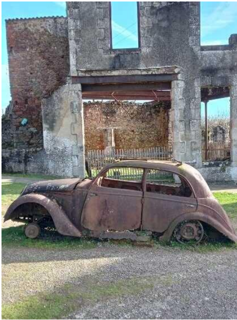
Une Citroën Traction Avant brûlée sur le champ de foire.