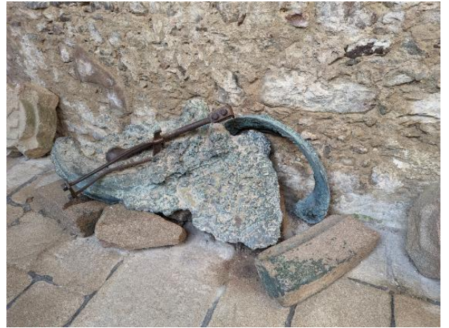
Les restes de la cloche de l'église.