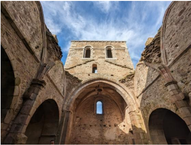
L'intérieur de l'église où ont péri les femmes et les enfants.