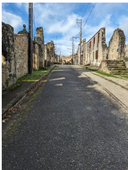
La rue principale du bourg. Au sol, les rails du tramway qui partait vers Limoges.

Quelques photographies de cette sortie pédagogique et mémorielle :