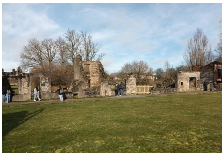
Le champ de foire où la population a été rassemblée par les Waffen S.S.