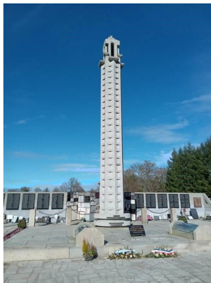
Le Mémorial financé par la population locale en souvenir des disparus.